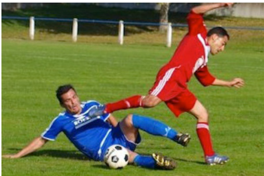
En DH il y a 20 ans, l'AS Westhouse (en bleu) évolue aujourd'hui en D1.

Pensionnaire de D1, l'AS Westhouse affronte ce week-end l'AS Strasbourg (Pro) en Coupe d'Alsace. L'occasion de s'attarder sur un club qui fête ses 75 ans cette année et qui en guise de cadeau d'anniversaire, aimerait sortir d'une très longue traversée du désert.